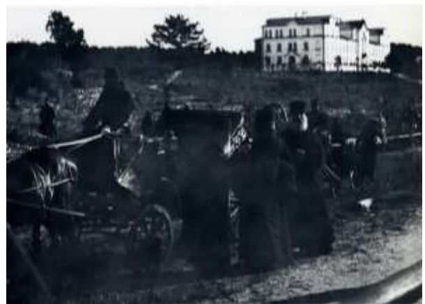
Arkkipiispa Antoni saapuu Konevitsaan.