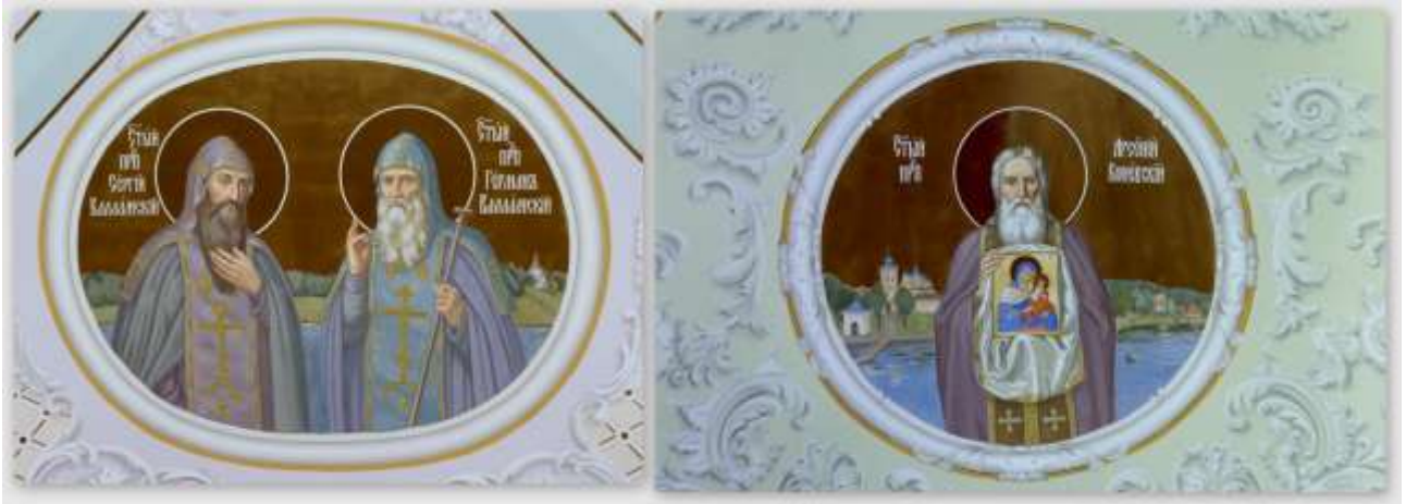
Pyhittäjäisien Sergei ja Herrman Valamolaisen ja pyhittäjäisä Arsenin ikonit Konevitsan alakirkon freskoissa.