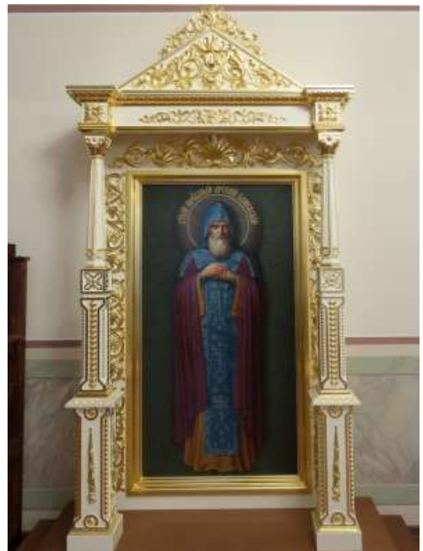
Ikonin toisinto 2020.