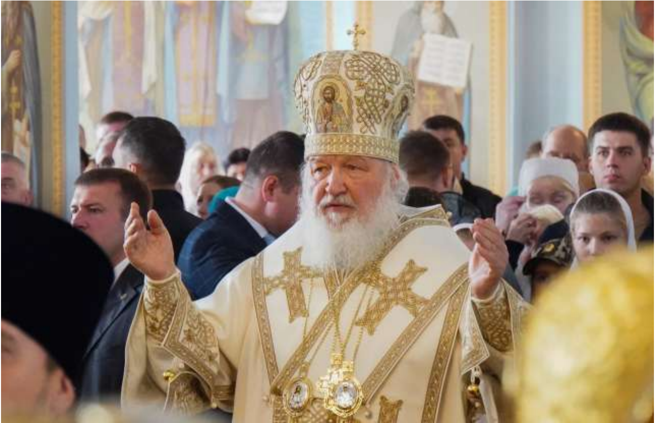
Luostarin ja veljestön juhlaa Pyhän Edelläkävijä ja Kastaja Johanneksen juhlana 7.heinäkuuta.