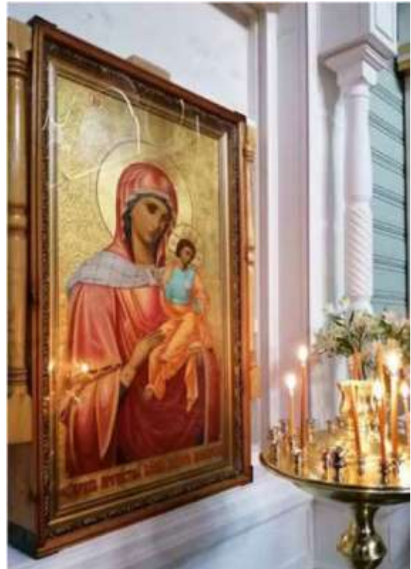
Konevitsan Jumalanäidin ikonin toisinto Pyhän Spiridonin kirkossa Lomonosovissa.