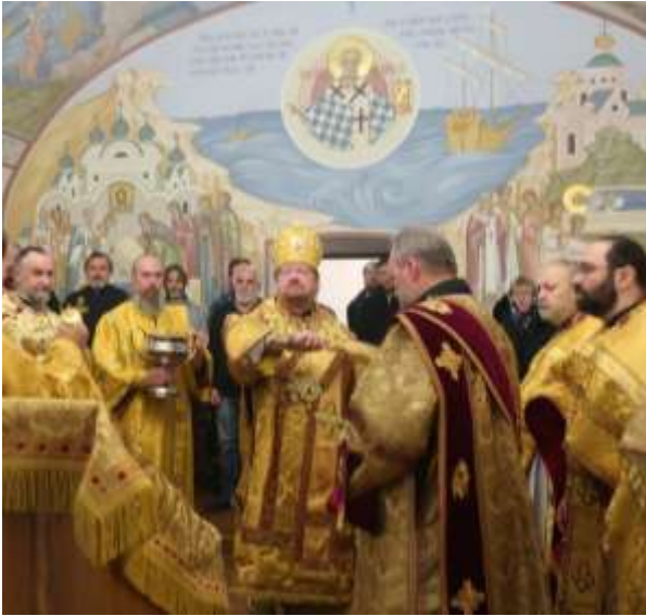
Piispa Ignati vihki Nikolskin kirkon 11.12.19