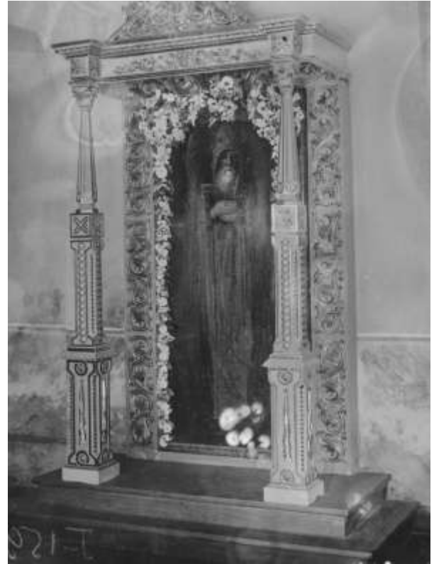
Pyhittäjä Arsenin muistoarkun päällä ennen ollut ikoni.