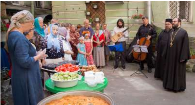
Sisäpiha tarjoaa rauhallisen tilan kirkollisille juhlille.