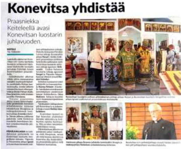
Pielavesi-Keitele-lehti raportoi Arsenin praasniekasta Keiteleellä.