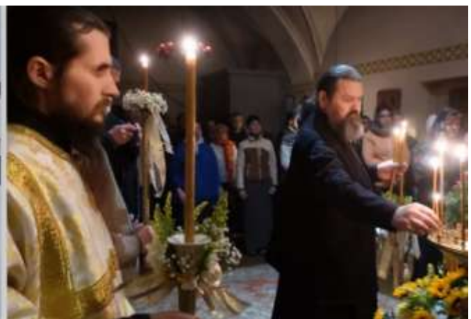
Veljestö saapuu joululiturgian lämpöön.