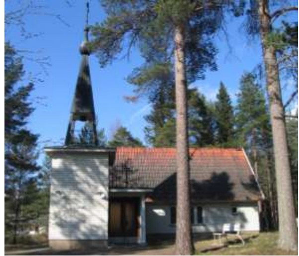
Martinniemen tsasouna Oulussa.

Saarijärven pyhittäjä Arsenin muistolle rakennettu tsasouna valmistui vuonna 1989. Tsasouna on pyöröhuone, pitkäkirkkotypyppinen rukoushuone. Lyhytnurkille salvottu länsitorni kohoaa sipulikupoliksi. Tsasounan ikonit on maalannut Jyrki Pouta . Tsasouna sijaitsee Jyväskylän ortodoksisen seurakunnan alueella. Palveluksia siellä on kerran kuukaudessa. Tänä vuonna Saarijärvellä vietetään tsasounan 30-vuotisjuhlaa.