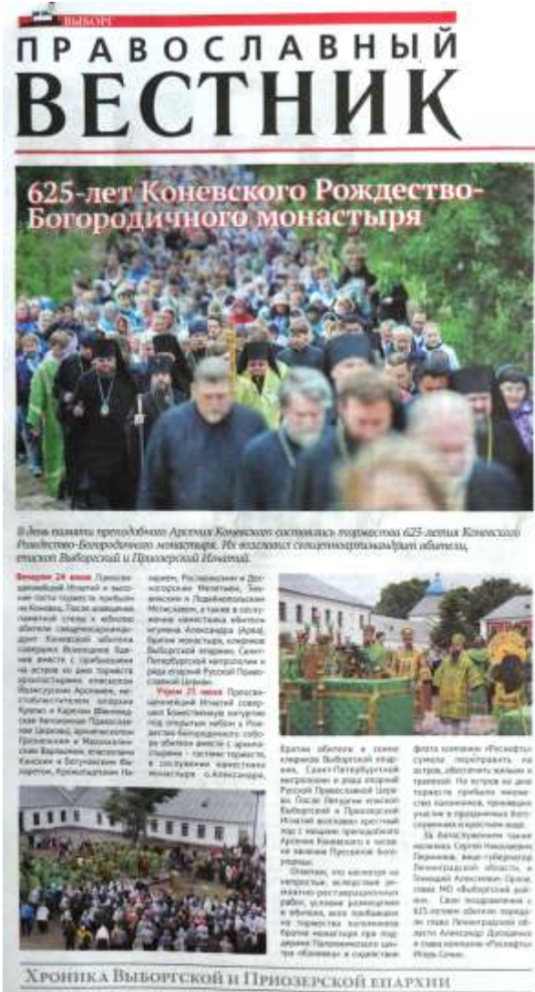
Pravoslavni Vestnikin Viipurin ja Priozerskin hiippakunnan kesäkuun 2018 numeron etusivu.