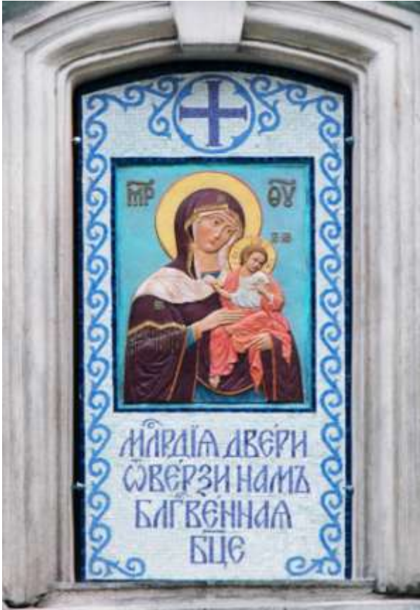
Ulko-oven yläpuolella on taiteilija Mihail Selezkijin toteuttama, säätä kestävä keraaminen ikoni.