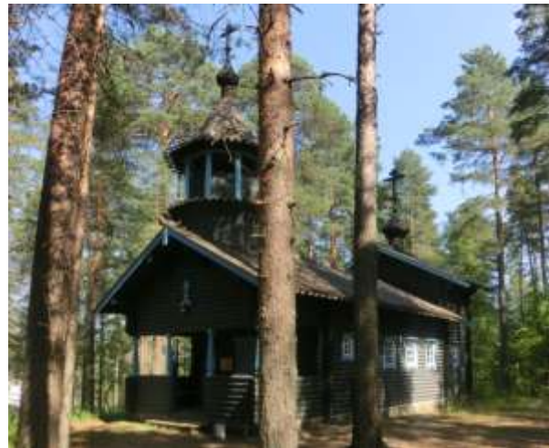
Saarijärven tsasouna.

Saarijärven tsasounan julkinen ilme muuttui radikaalisti viitisen vuotta sitten. Honkarakenteen talkoilla rakennettu tsasouna oli haalistunut korkealla mäellä vuosien saatossa auringossa. Seurakunnassa pohdittiin tsasounan ilmeen kirkastamista. Niin päätettiin siihen, että seinähirret maalattiin tumman harmaiksi ja ikkunanpielet, koris-