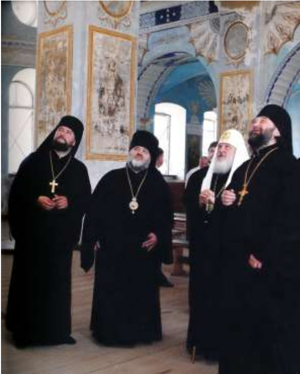
Moskovan ja koko Venäjän patriarkka Kirill vieraili luostarissa 2009.