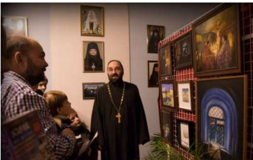
Tänä jouluna podvorjessa oli seurakuntalaisten kodeista koottujen taideteosten näyttely.

Kuten aikaisemminkin podvorje toimii luostarin Pietarin kaupunkiedustontona, jossa on piispan ja igumenin vastaanottohuoneet sekä kanslia. Podvorjen kirkko palvelee hengellisesti pietarilaisia. Jumalanpalveluksia toimitetaan päivittäin, ei kuitenkaan maanantaisin.