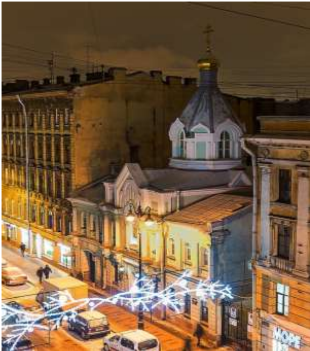
Podvorjen osoite on Zagorodnyi prospekt 7.

muuttaa rakennukseen. Vuoden 1997 tammikuun 6. päivänä toimitettiin ensimmäinen rukoushetki ja 19. syyskuuta 1997, 65 vuoden katkoksen jälkeen, toimitettiin ensimmäinen liturgia. Ristin ylentämisen juhlapäivänä 27. syyskuuta 1998 podvorjen rakennuksen ylle nostettiin kahdeksankulmainen risti.