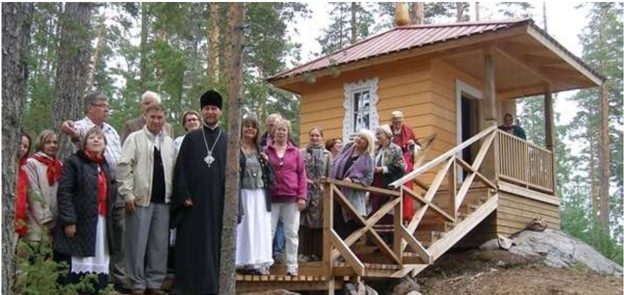
Pyhittäjä Arsenin tsasounan vihkiäisjuhlakansaa Saimaan Skiittasaarella 2011.

Tällä hetkellä on valmiina viisi tsasounaa. Vielä puuttuu kaksi tsasounaa. Konevitsan tsasounan rakennuspuut vietiin moottorikelkalla kevättalvella Saimaan jäitä pitkin Ilkon saareen. Työtä haittasi jäällä ollut vesi ja jyrkkä rakennuspaikka rinteessä.