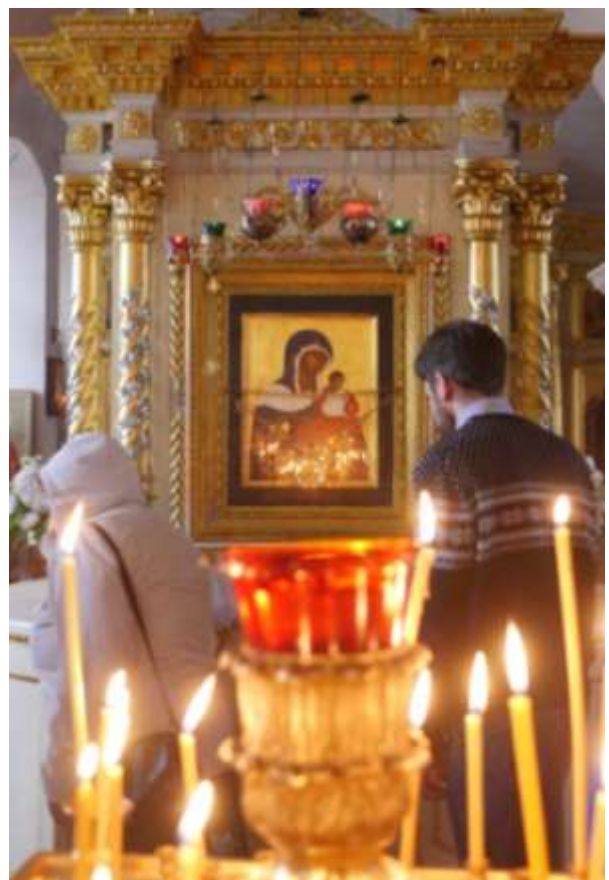
Jumalanäidin ikoni omalla paikallaan.