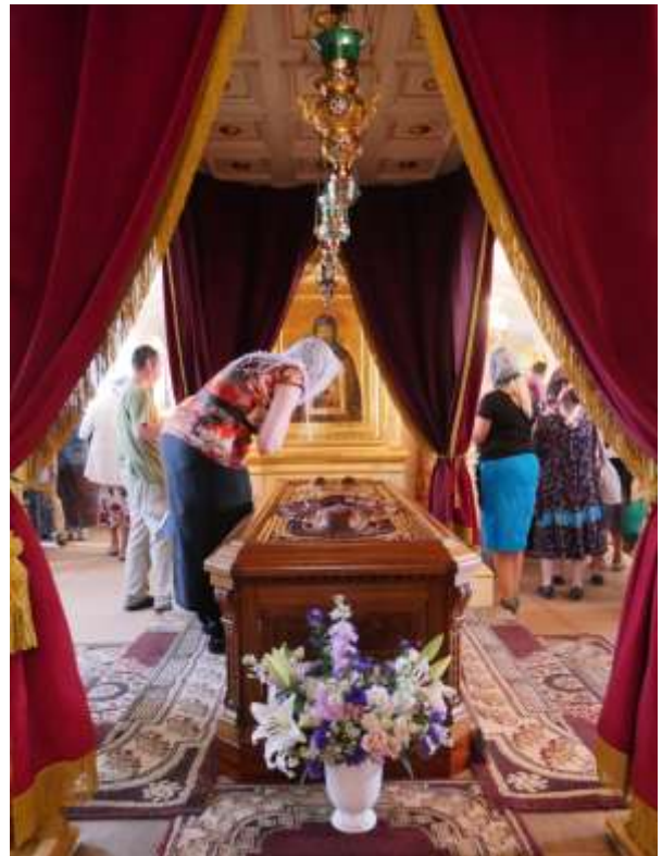
Pyhittäjän muistoarkku kesällä 2018.

Konevitsan luostari alkoi tulla esiin unohduksen varjosta. Vuonna 1995 Jumalanäidin syntymän kirkko Priozerskissa (entinen Käkisalmi) luovutettiin Konevitsan luostarille podvorjen ominaisuudessa. Vaikeampi asia oli luostarin Pietarissa Zagorodnyj prospektilla sijaitsevan historiallisen podvorjen kanssa. Luostarille arkkitehti I.B.Slupskin suunnitelman mukaan vuosina 1864-66 rakennettua rakennusta oli muutettu ja vuodesta 1956 siinä toimi julkisivujen korjaus- ja rakennustöiden yritysten yhteenliittymä «Fasadremstroj». Huolimatta virallisesta entisen tsasounan