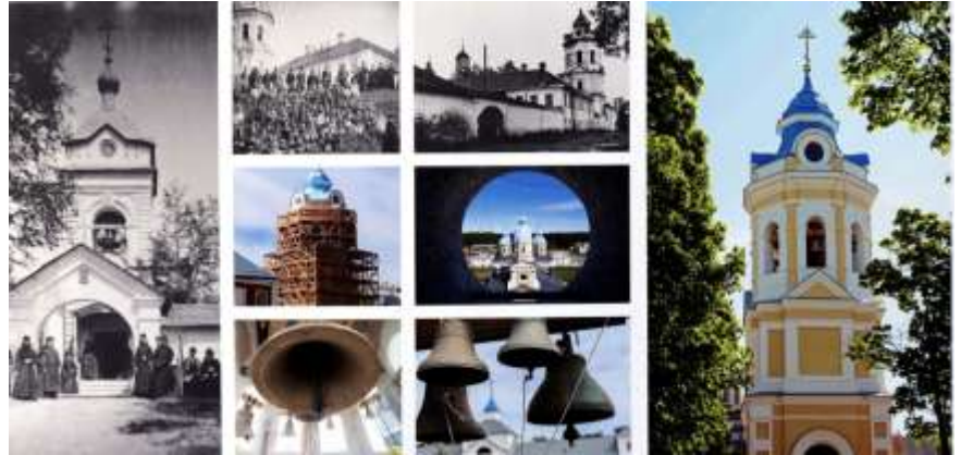
Havainnekuvat esittävät Sortanlahden sataman ja Konevitsan luostarin lähitulevaisuutta.

kellotapulien jälleerakennus, siihen valettiin uusi kirkonkellojen sarja, yläkirkon, Valkoisen hotellin, ns. köyhien suomalaisten majatalon ja pyhän Nikolaoksen tsasounan kunnostus, uuden laiturin rakentaminen ja siitä luostari-kehään asti ulottuvan alueen kunnostaminen. Lisäksi vedettiin vedenalainen kaapeli, joka liitti luostarin yleiseen sähköverkkoon.