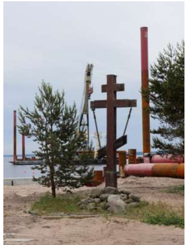
Uutta syntyy. Konevitsaa kesällä 2018.

Toimitus ja taitto Heikki Jääskeläinen. Kuvat Konevitsan kävijöiden ja ystävien. Kansikuva N. Avizovan postikorttisarjasta 1990-luvulta.