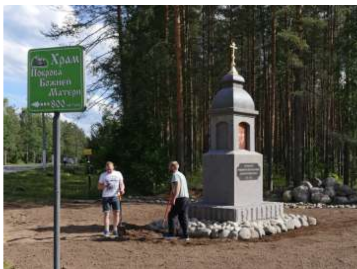
Laatokan rantatien ja Pyhjärven, Plodvojen, risteykseen valmistui uusi tienviitta ja patsasmuotoinen matkamiehen risti, johon on upotettu Konevitsan Jumalanäidin ikoni. Enää ei epähuomiossaakaan voi ohittaa meille tärkeätä risteystä.