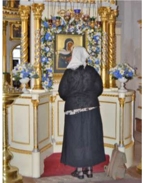
”Puhtaimman Äitinsä ikonin kautta Herra kutsuu meitä.”

Oli suunnattoman hyvä olla, nyt olemme Laatokalla Konevitsan pyhällä saarella kun-