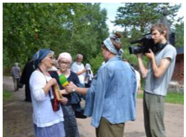
Toimittajalle tämä oli uutinen: Ennen vuotta 1944 Konevitsan saarella asui myös suomalaisia sotilaita perheineen. Lapsia varten saarella oli oma koulunsa.