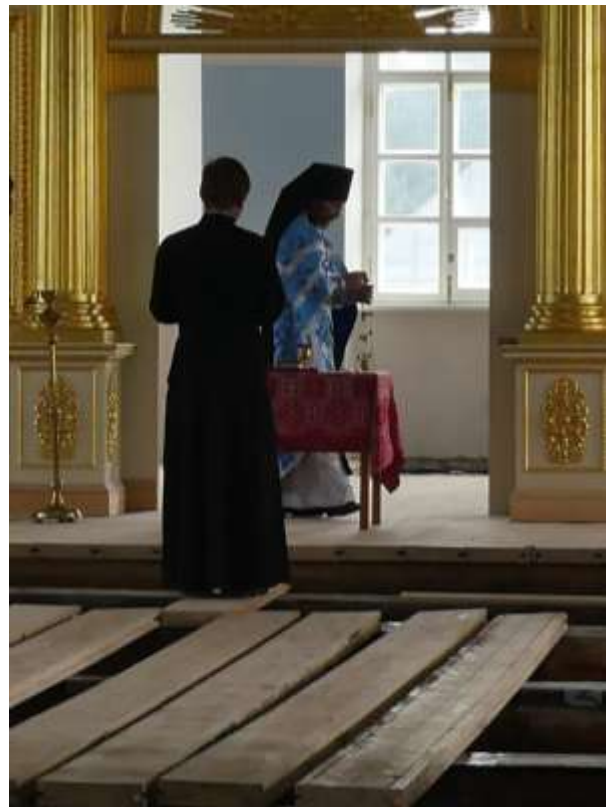
Yläkirkon lattia oli auki. Uudet lankut olivat pinossa ja maalattavina luostarin pihalla.