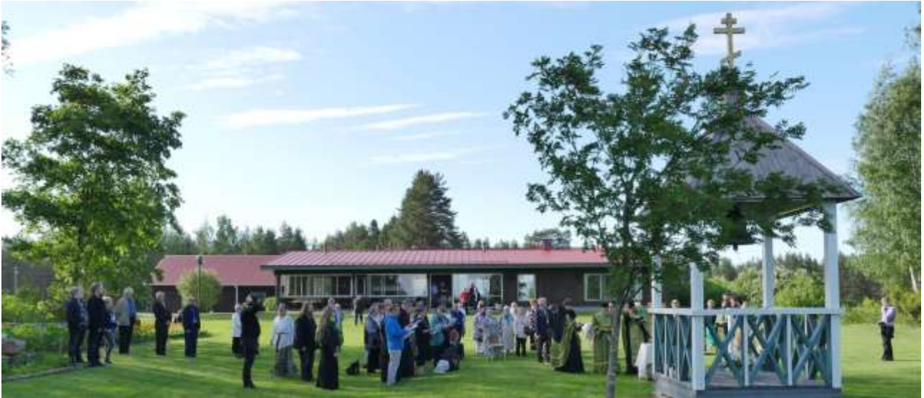
Suuri ehtoopalvelus Hiekan tilalla, jossa luostari toimi vuosina 1940-1956.