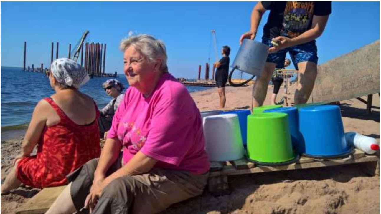
Ja valmista tuli.