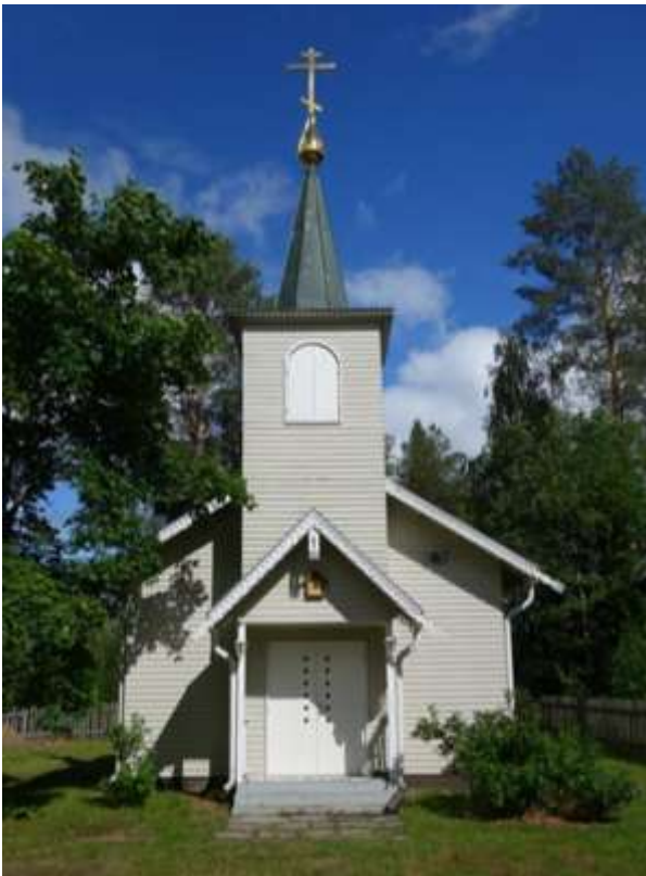
Arsenin kirkko Keiteleellä. Kohta Konevitsan kaikkien pyhien kirkko Sortanlahdessa.

Valkoisen hotellin kellaritiloihin suunnitellaan ompelimoa, jossa valmistetaan ja huolletaan luostarin kirkkojen ja tsasounien tarvitsemat jumalanpalvelusasu.