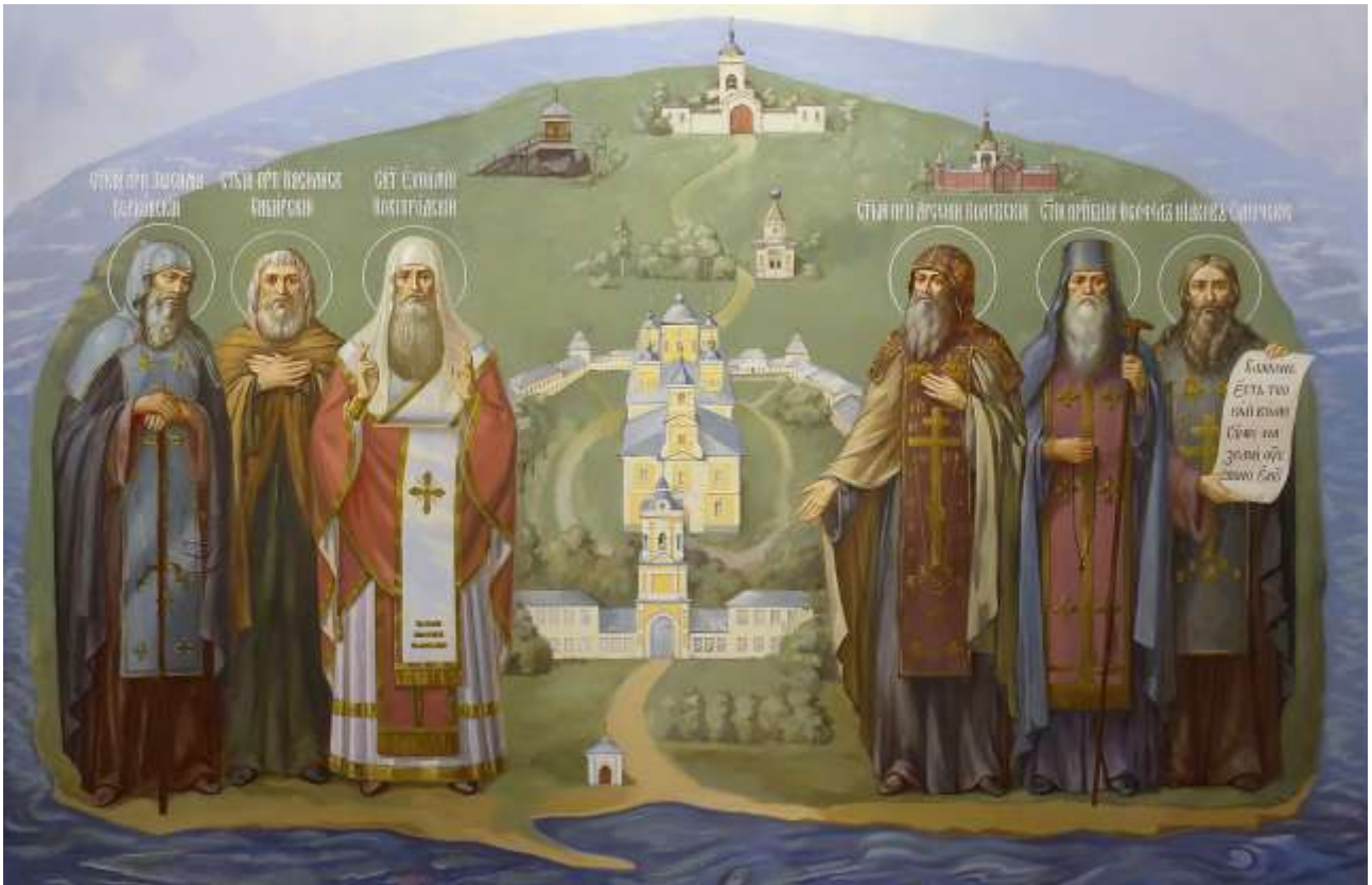
Pyhä Zosima Verkovski (vas.), pyhä Vasilisk Siperialainen, pyhä Eufimi Novgorodilainen, pyhittäjä Arseni Konevitsalainen sekä pyhittäjät Feofil ja Jakob Omutskilaiset.