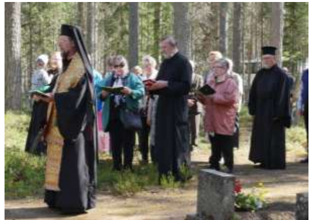
Panihida 11. kesäkuuta.