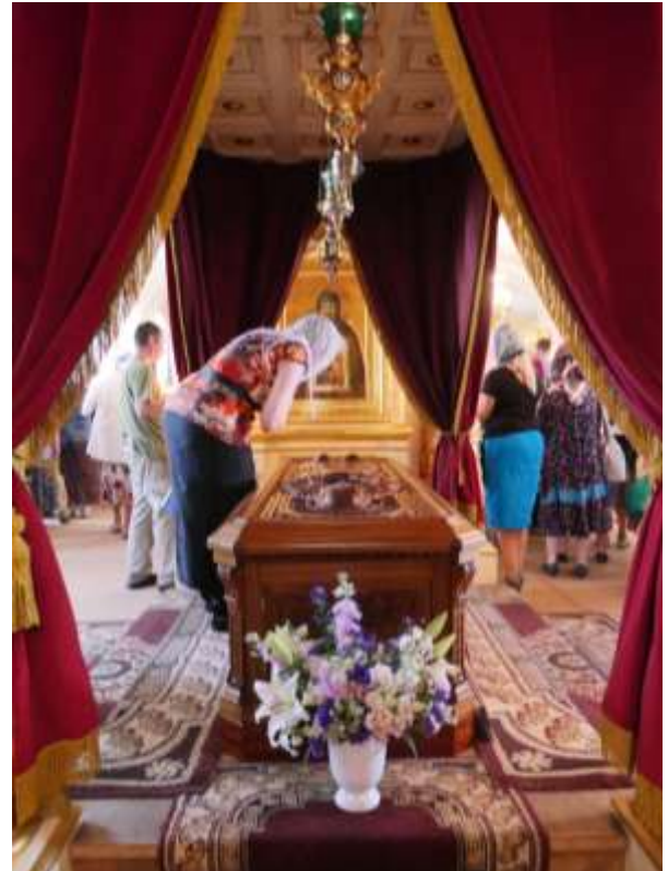
”Oi isämme Arseni, rukoile lakkaamatta meidän kaikkien puolesta,”