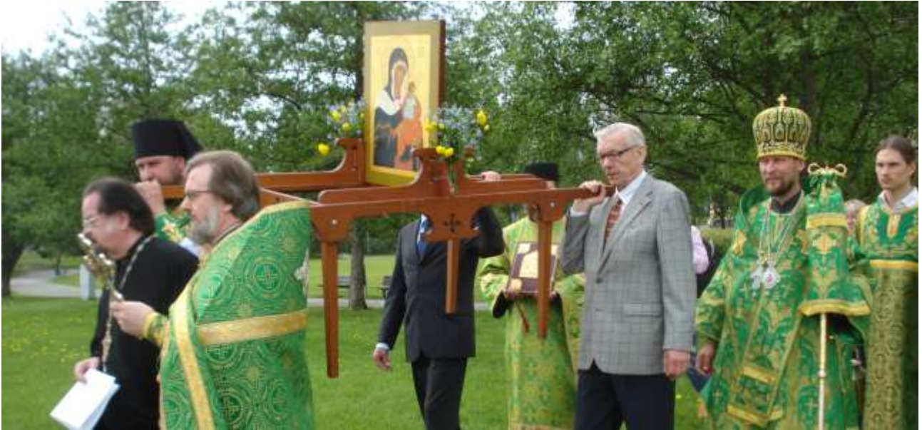
Ristisaatto Kuopiossa 12.6.2009

juuteni aikana luostarin jälleenrakentaminen on tapahtunut 70%:sti suomalaisten avulla". Tämä lausuma on ollut kaunis kiitos Konevitsa ry:lle ja kaikille sen kautta toimineille. Siihen aikaan saarella mottona olikin: "Ei päivääkään ilman suomalaisia luostarissa".