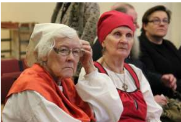
Keitä ovat he ja mistä?