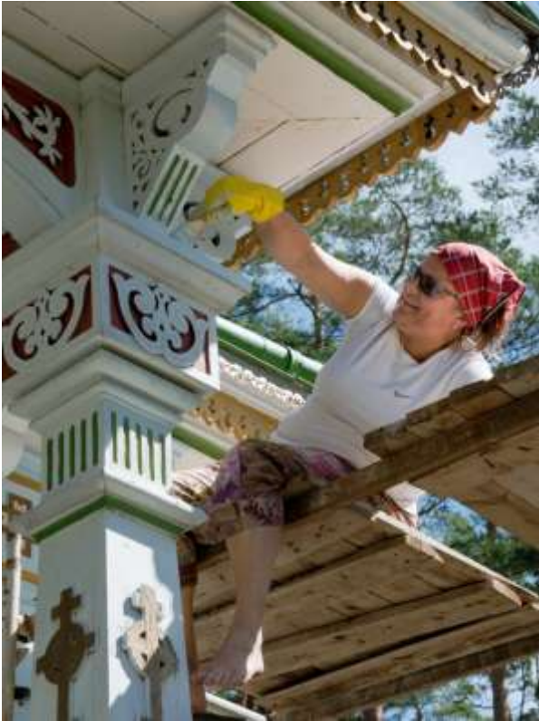
Kesän 2016 talkoolaisen työnäytös.