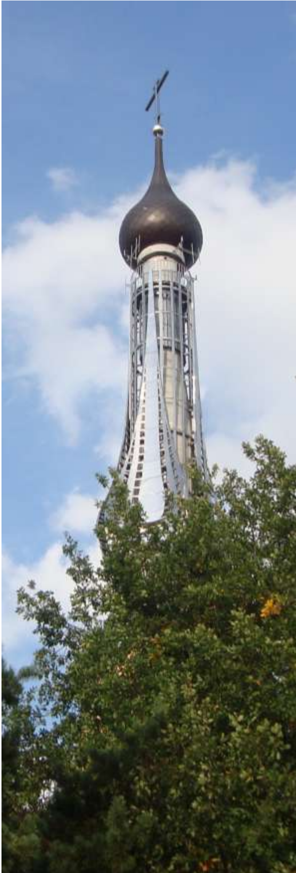
Pyhän Hengen kirkon torni Bialystokissa.