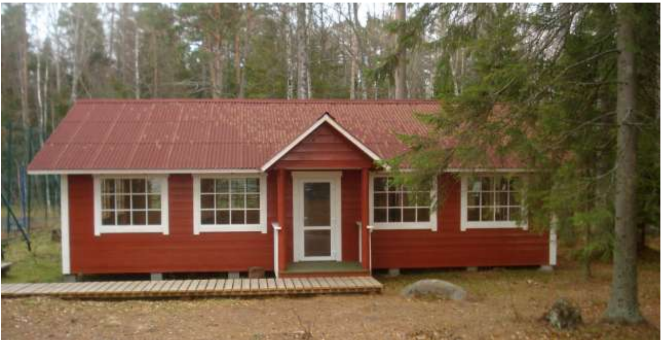
Nuorten leirikeskuksen paviljonki palvelee paitsi nuoria myös luostarin kokoustilana.

Samana iltana piispa Ignati vihki Konevitsan skiitan taakse, urheilukentän viereen rakennetun paviljongin, jossa leirillä olevat lapset sateen sattuessa voivat pelata pelejä ja viettää aikaansa. Siellä voidaan myös pitää erilaisia neuvotteluja ja keskusteluja.