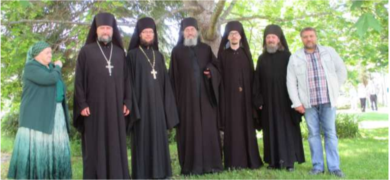
Luostarin puutarhassa. Tällä kertaa Valamossa Heinävedellä 27. kesäkuuta.