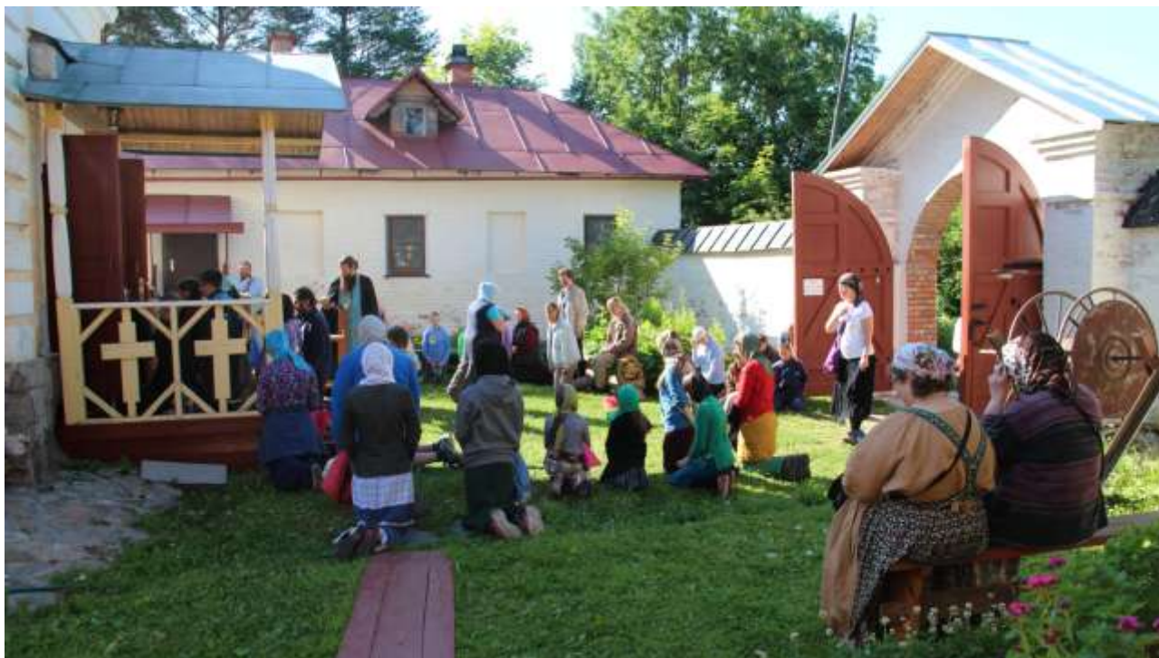
Kasanin ja Kasanilaisen Jumalanäidin kirkon vihkiminen 21.7.2015.