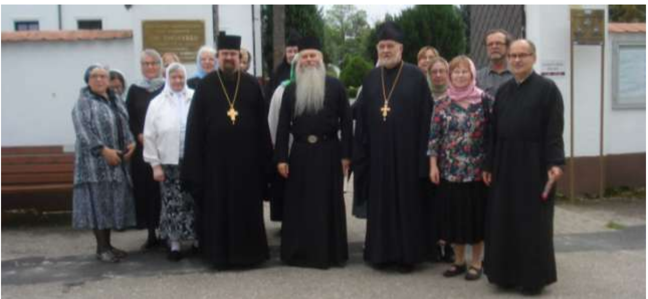
Pyhän Onufrioksen luostari on lainannut veljiään Uuden Valamon slaavilaisiin palveluksiin.