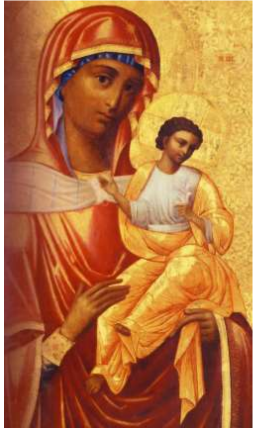
Lomonosovista löytynyt, Konevitsaan palannut Konevitsalaisen Jumalanäidin ikoni.

Reformaatio liittyikin kirkon perinteiseen opetukseen Neitsyt Mariasta, erityisesti Efeson (431) ja Konstantinopolin (553) kirkolliskokousten opetukseen autuaasta neitsyt Mariasta Jumalan äitinä ja korkeasti