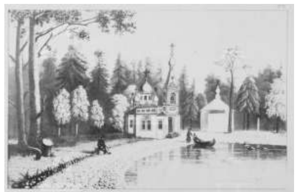
Tältä Konevitsalaisen Jumalanäidin ikonille pyhitetty skiitta näytti valmistuttuaan 1876.