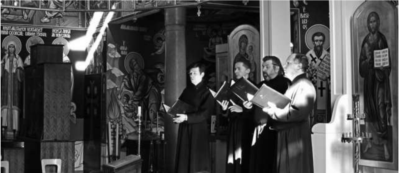
Herman Alaskalaisen kirkko Espoon Tapiolassa 2014.