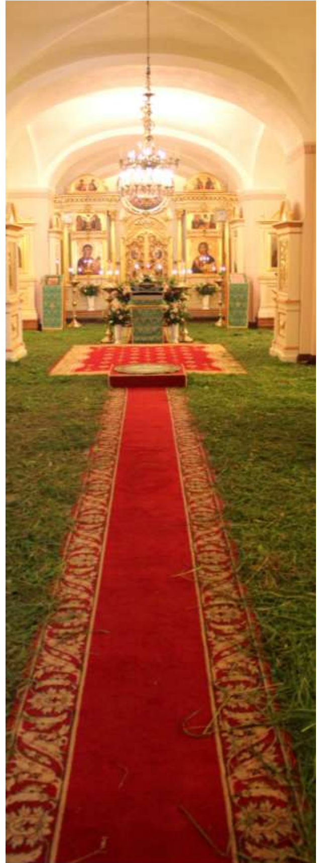
Pyhittäjän juhlaaksi kirkon lattia peitettiin tuoreella ruoholla.

Meidän kahden ja puolen viikon (saimme kaksi lisäpäivää, kiitos Veikon ja