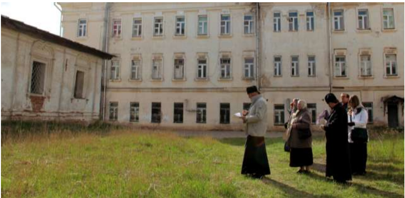
Rukoushetki Derevjanitsan pihalla.