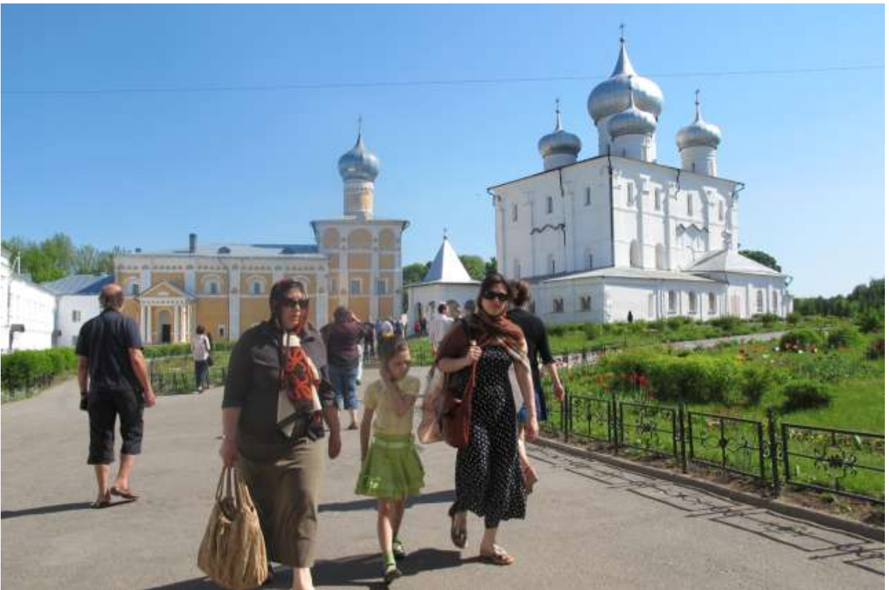
Lisja Gorasta lähtöisin oli myös Hutinin luostarin perustaja pyhittäjä Varlaam. Hutinin luostari sijaitsee kolmen kilometrin päässä Lisja Goran kukkulalta.