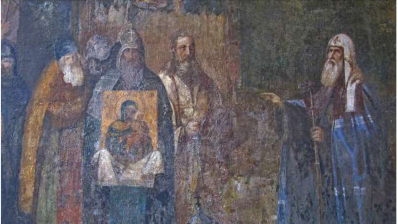
Pyhittäjä Arseni ja arkkipiispa Eufemi, Lisja Goran kilvoittelijat tapaavat Konevitsassa. Yksityiskohta freskosta Konevitsan pyhän portin seinässä.