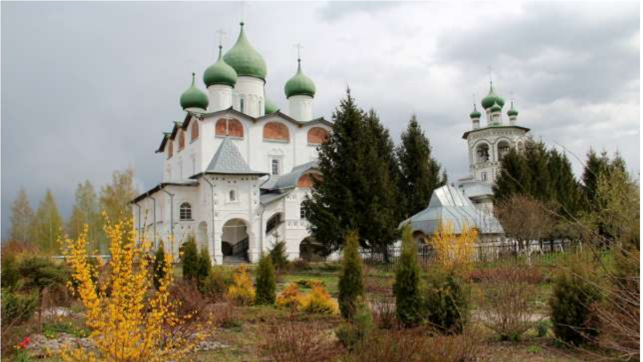
Pyhittäjä Eufimin pyhäinjäännöksiä säilytetään Nikolo-Vjazhishtskin luostarissa Pyhän Nikolaoksen katedraalissa Novgorodista 12 kilometriä Lugan suuntaan.